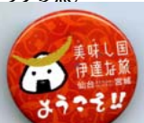
「伊達」をイメージした濃い赤色