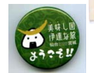
「新緑」をイメージした緑色