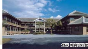
登米教育資料館 (登米教育資料館 入場は別料金320円)