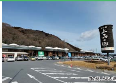
道の駅・上品の郷