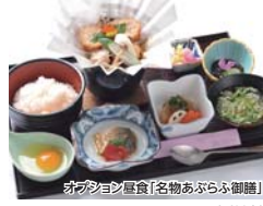
オプション昼食「名物あぶらふ御膳」 (別料金)