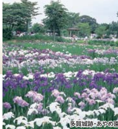
多賀城跡・あやめ園