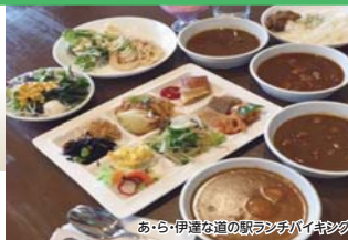
あ・ら・伊達な道の駅ランチバイキング