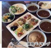
昼食バリエーション