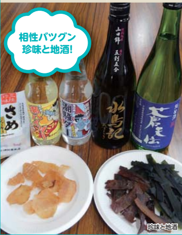
相性バツグン 珍味と地酒!