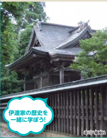
伊達家の歴史を一緒に学ぼう!