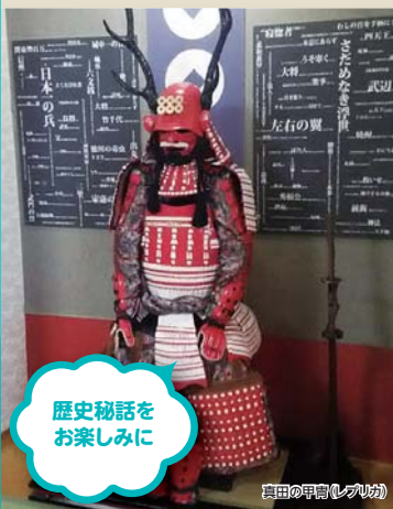
歴史秘話をお楽しみに