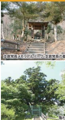
支倉常長メモリアルパーク・支倉常長の墓