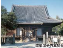
陸奥国分寺薬師堂