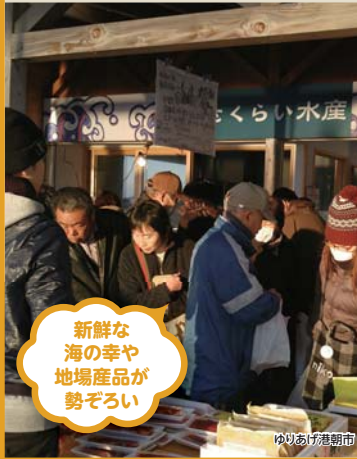
新鮮な海の幸や 地場産品が勢ぞろい