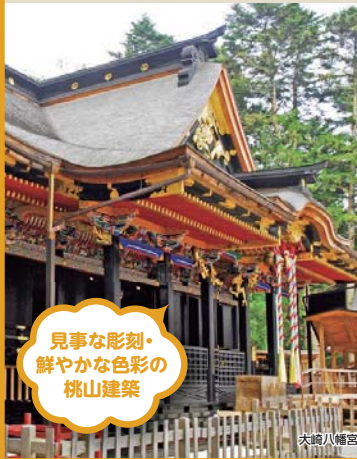
見事な彫刻・鮮やかな色彩の 桃山建築