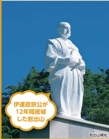
伊達政宗公が 12年間居城 した岩出山