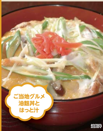
ご当地グルメ 油麩丼と はっと汁