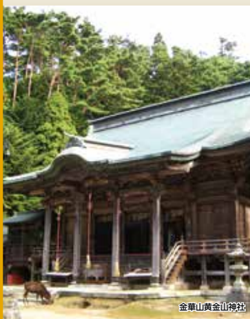
金華山黄金山神社