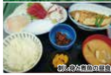
刺し身と煮魚の昼食