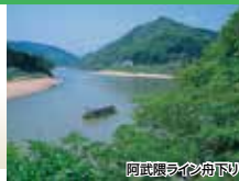
阿武隈ライン舟下り