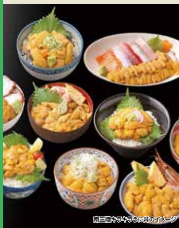
南三陸キラキラうに丼のイメージ