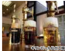
麒麟ビール仙台工場