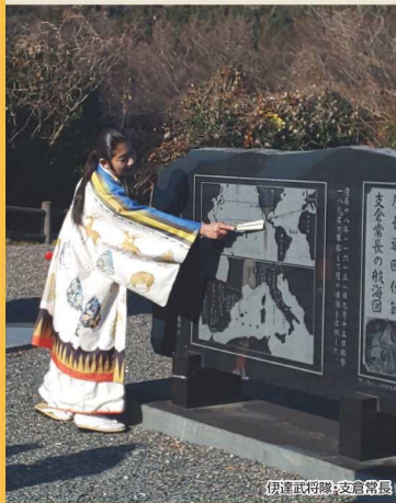
伊達武将隊・支倉常長