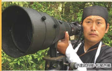
伊達武将隊・松尾芭蕉