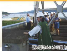
語り部さんによる案内