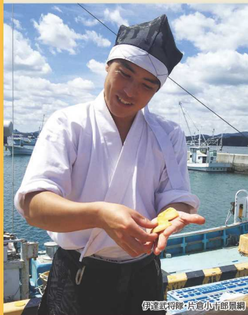
伊達武将隊・片倉小十郎景綱