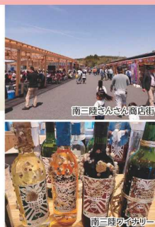
南三陸さんさん商店街