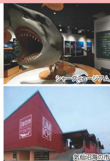
シーミュージアム