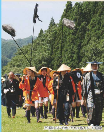
29回わらじで歩こう七ヶ宿イメージ画像