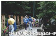
32回わらじで歩こう七ヶ宿イメージ