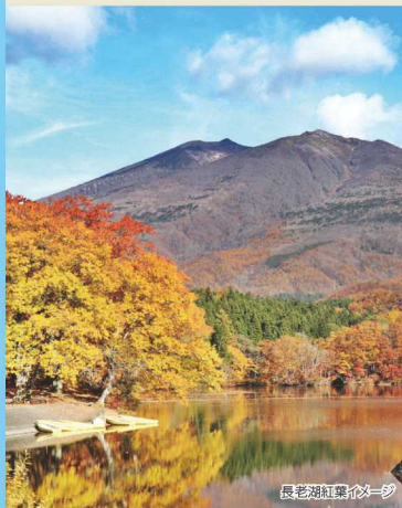
長老湖紅葉イメージ