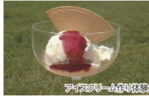
アイスクリーム作り体験