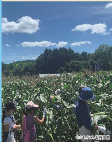
とうもろこし収穫体験