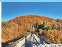
やまびこ吊り橋紅葉