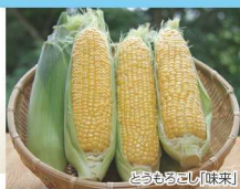
とうもろこし「味来」