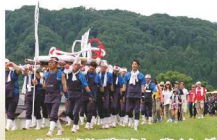
32回わらじで歩こう七ヶ宿イメージ