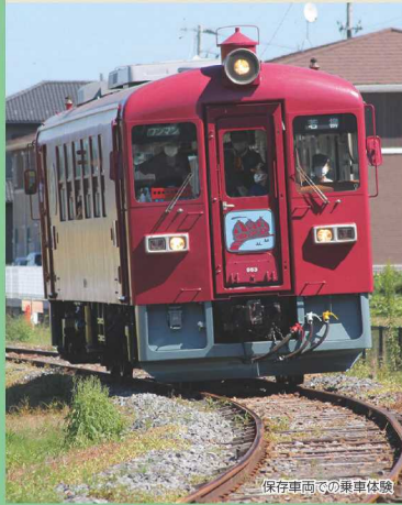
保存車両での乗車体験