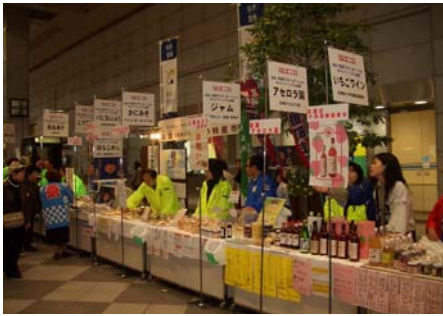
名亘秋の特産市会場の賑わい状況