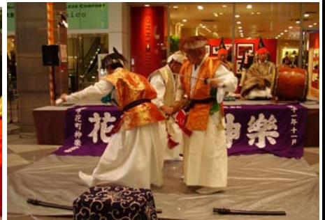
会場では、名取市の郷土芸能「花町神楽」(はなまちかぐら)を披露