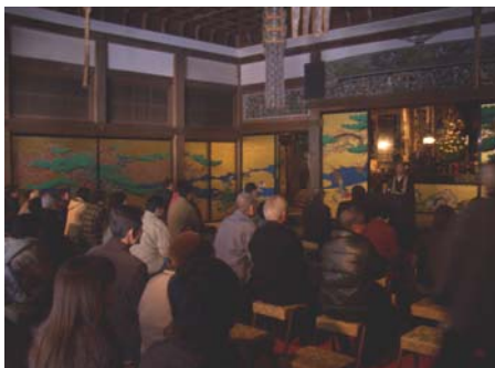
瑞巖寺で行われた法話