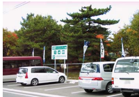
長者原SA(上り) 一般道側の新設駐車場