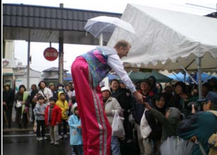
会場での大道芸パフォーマンス

白石市では、フレDCイベントとして初めて「大道芸&鍋料理食べまくり」と題したイベントを、市内すまいるひろばや商店街を歩行者天国にして開催しました。大道芸は勿論、地元の郷土芸能のほか沖縄エイサーも披露され、県内の4商工会議所青年部による創作鍋の提供とあわせて賑わいました。