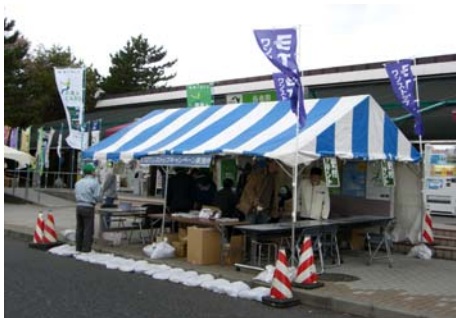
11月17・18日には長者原SA(下り)ではETC利用促進「ETCワンストップキャンペーン」のイベントも開催されました。