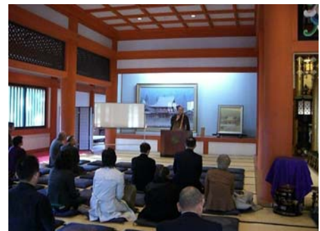
毛越寺で行われた法話