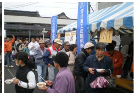
県内4商工会議所青年部の創作鍋に長い列が出来ました。