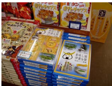
むすび丸クッキー