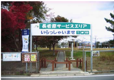
長者原SA(上り) 新設のウェルカムゲート

民間会員として仙台・宮城DC推進協議会へ参画していただいた、NEXCO東日本でもプレDCから新たな観光誘客と流動の拡大を目指した取組が、積極的に行われています。10月31日には長者原SA(上り)サービスエリアに、東北初の高速道路外からのお客様が気軽にサービスエリアで食事や買物を楽しんでいただくための、お迎え「ウェルカムゲート」と一般道側に13台分の駐車場が新設されました。今回のプレDC事業「仙台・宮城まるごと召し上がり！スタンプラリー」チェックポイントとして、特別メニュー「ミンク鯨のステーキ丼」もお楽しみいただけますので、是非、ご利用ください。