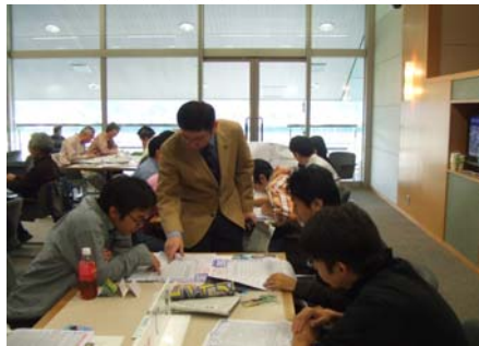
講師から競馬解説を受ける参加者