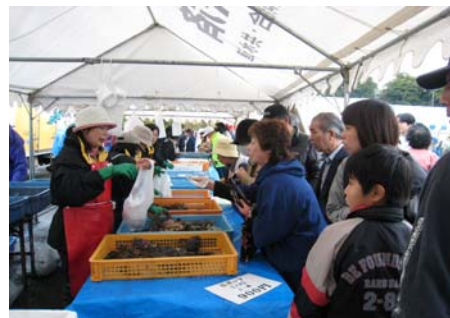
多くのお客様が来場した七ヶ浜町ぼっけと収穫祭の会場とぼっけの販売風景