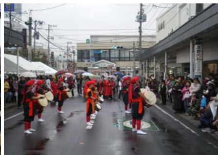
沖縄郷土芸能「エイサー」もお披露目